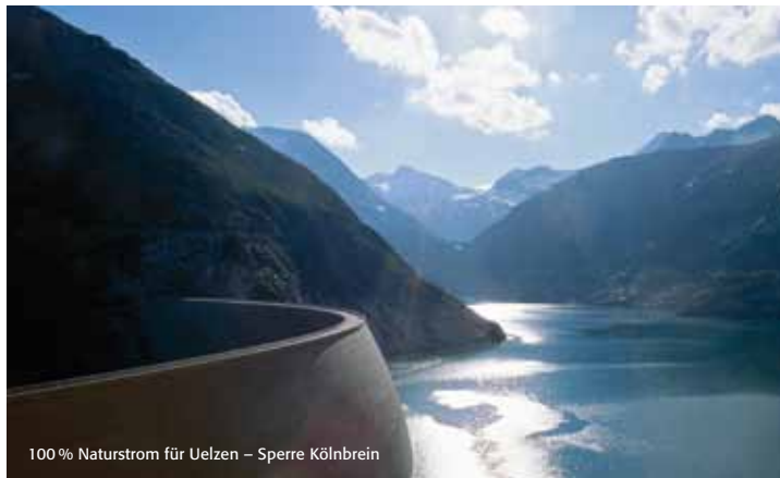
100 % Naturstrom für Uelzen – Sperre Kölnbrein